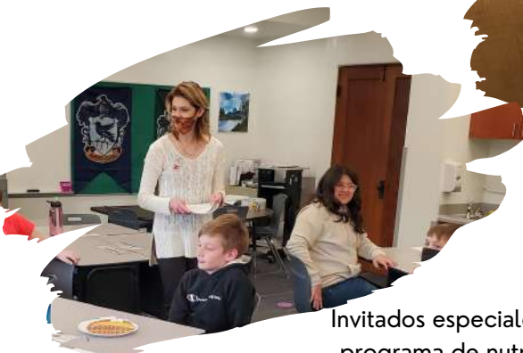
Invitados especiales, como el programa de nutrición de la Universidad de Nebraska.