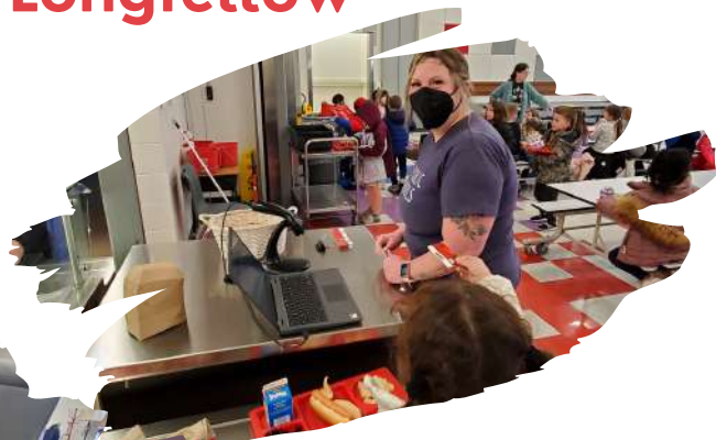
Almuerzo de cuarenta minutos y recreo.