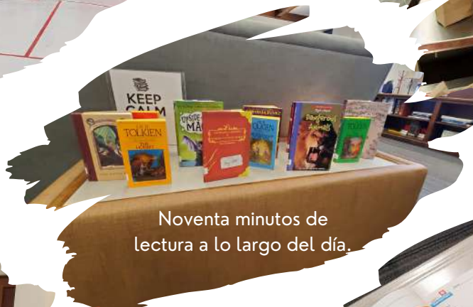
Noventa minutos de lectura a lo largo del día.