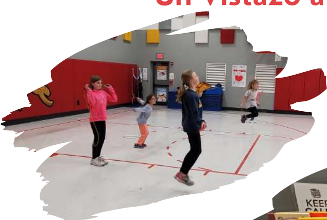
Cuarenta minutos de actividades especiales (educación física, música y arte).